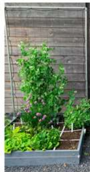
Rek voor klimplanten bij vierkante meter bak