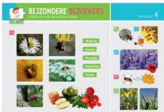
Links: praatplaten bij de moestuin