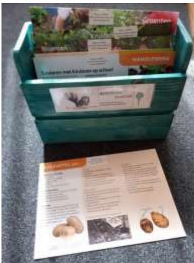
Kist met instructiekaarten voor de moestuin

De subsidie van JLE kun je ook benutten voor het Vergroenen van het schoolplein .