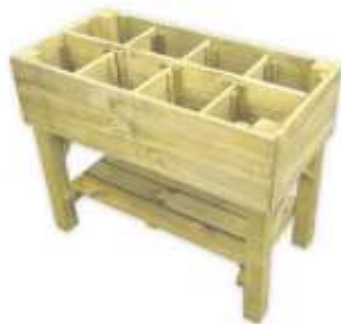
Kweektafel op poten