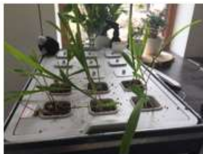
Zaai bakjes bij kweekkasje