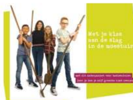
Gratis Moestuin zadenpakket