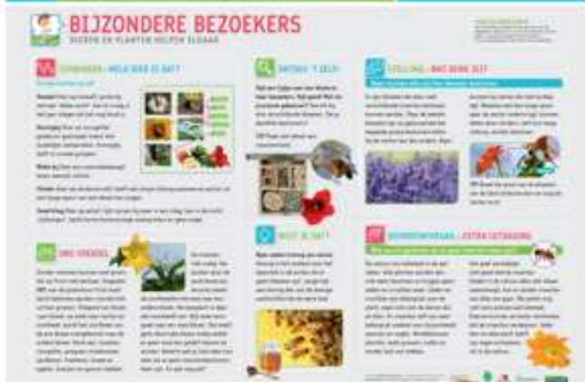
Een deel van deze materialen is aangeschaft met een bijdrage van Stichting Natuurfonds Sittard-Geleen.